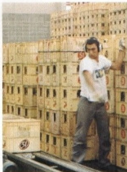
Vasilhames: sistema automático

Foi preciso também reorganizar as áreas de carga e de descarga, os depósitos e os estoques, visando o cumprimento do cronograma estipulado. Afinal, as fábricas de Pirassununga escoam 1,3 milhão de dúzias de litros/mês de destilados, dos quais 1,1 milhão de dúzias da aguardente 51.